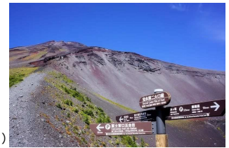
富士山宝永火口付近(イメージ)