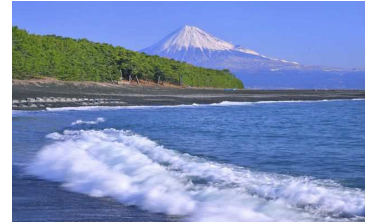
三保の松原・三保海岸(イメージ)